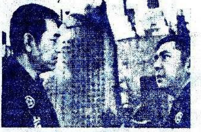
鶴田浩二と若山富三郎

スチール：木村 武司 録音：宮本信太郎 照明：雨森義光 美術：雨森義光 録音：渡部芳丈 スチール：沼角義雄 編集：宮本信太郎